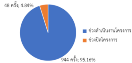
รูปที่ 5 ขั้นตอนการดำเนินการวิจัย

จากการรวบรวมข้อมูลทฤษฎีจากเอกสารต่าง ๆ ที่เกี่ยวข้องกับโครงการก่อสร้างโรงไฟฟ้าตั้งแต่เริ่มต้นดำเนินการก่อสร้างจนถึงช่วงปิดโครงการ พบว่าปัญหาความล่าช้าส่วนใหญ่เกิดขึ้นในช่วงดำเนินการโครงการ จำนวน 944 ครั้ง คิดเป็นร้อยละ 95.16 และพบปัญหาความล่าช้าในช่วงปิดโครงการ จำนวน 48 ครั้ง คิดเป็นร้อยละ 4.84 ดังในรูปที่ 5