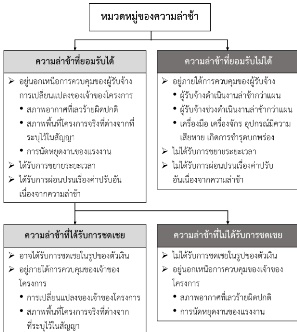
รูปที่ 2 หมวดหมู่ของความล่าช้า [7]

ทำงานจากแผนและข้อกำหนด 5) สภาพพื้นที่โครงการจริงที่ต่างจากที่ระบุไว้ในสัญญา 6) สภาพอากาศที่เลวร้ายผิดปกติ 7) การแทรกแซงจากหน่วยงานภายนอก 8) การขาดการดำเนินการจากหน่วยงานภาครัฐ 9) ความบกพร่องของข้อกำหนดในสัญญา 10) พบสิ่งก่อสร้างระบบสาธารณูปโภคใต้ดินเดิม