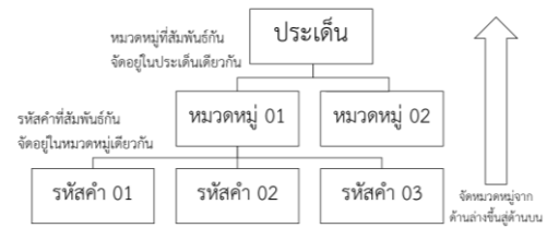
รูปที่ 4 การจัดหมวดหมู่ของข้อมูล

เมื่อรวบรวมข้อมูลจากการเก็บข้อมูลที่ได้จากรายงานความก้าวหน้า เอกสารโต้ตอบระหว่างกลุ่มบริหารโครงการ การก่อสร้างและบริษัทคู่สัญญา ตั้งแต่เริ่มต้นดำเนินการก่อสร้างจนถึงช่วงปิดโครงการ และจากการสัมภาษณ์เชิงลึกแล้วเสร็จ จะดำเนินการแบ่งข้อมูลเป็นส่วนย่อย ๆ ที่มีความหมายในตัวเอง (หน่วยของความหมาย – Unit of meaning) จากนั้นให้รหัสข้อมูล (Coding) แก่หน่วยของความหมาย แล้วทำการจัดหมวดหมู่ของข้อมูลและประเด็นหลักของหมวดหมู่ของข้อมูล ดังในรูปที่ 4